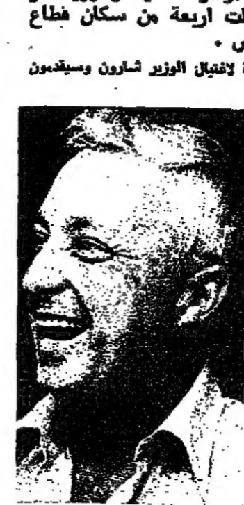
٣٦٦ مليون ليرة ميزانية بلدية شفا عمرو

شفا عمرو - من ميمون ابو عبيد - أقر المجلس البلدي في مدينة شفا عمرو في جلسته الأخيرة التي عقدت امس ميزانية البلدية لسنة الحالية ٨١-٨٠ . بلغت ٣٦٦ مليون ليرة ، وتشمل هذه الميزانية المقترحة نفقات شتى المشاريع في كافة المجالات .